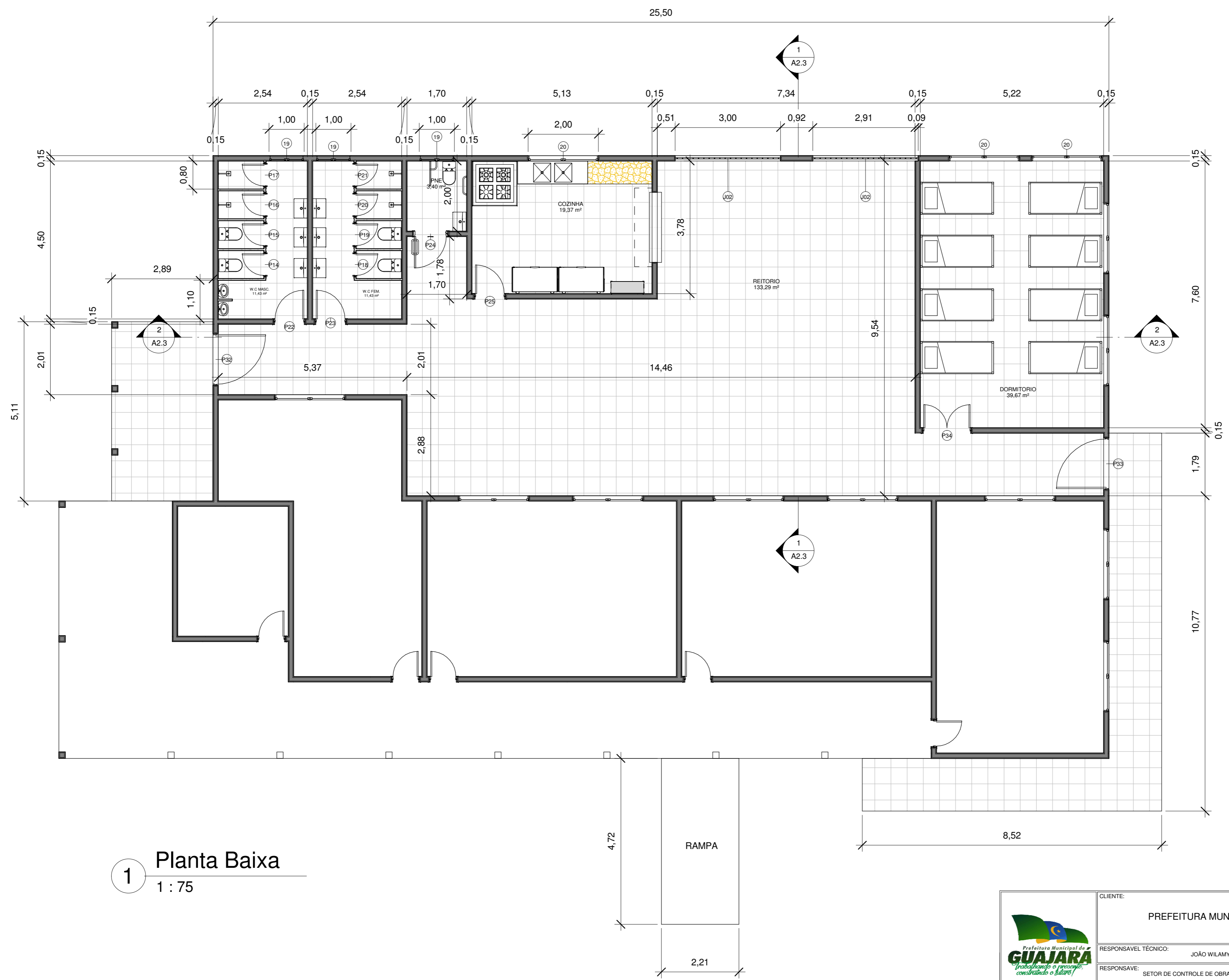
1 Planta Baixa 1 : 75